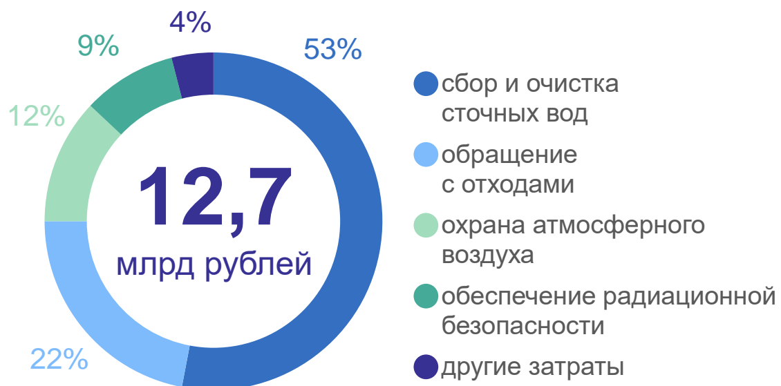
Текущие затраты на охрану окружающей среды по направлениям природоохранной деятельности в 2023 году